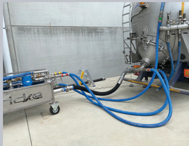
Transportador Móvel Pulse-Flow™ da Gericke