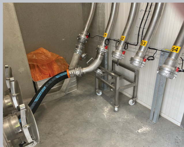
Transportador Móvel Pulse-Flow™ da Gericke para tubulações de silos