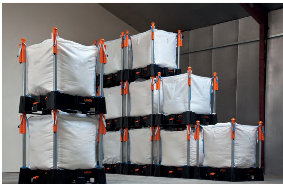
Afb. 3 Het Indus Neva-systeem voor de opslag van big bags

Het Gericke/Indus big bag losstation heeft niet alleen weinig hoogte nodig, maar kenmerkt zich bovendien door een kleine footprint. Er is geen takel met hefkrans die ook vloeroppervlak vereist. Voorts heeft het losstation een korte loscyclus. Een big bag met een moeilijk stromend poeder laat zich binnen drie minuten volledig lossen, waarna direct weer een andere unit op het losstation kan worden geplaatst. BULK